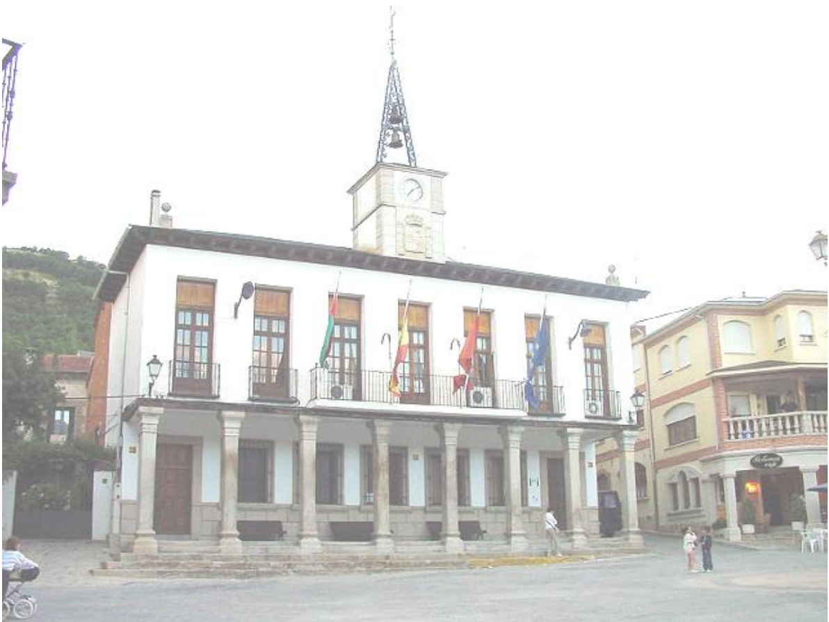
Imagen 2. Fotografía del edificio.