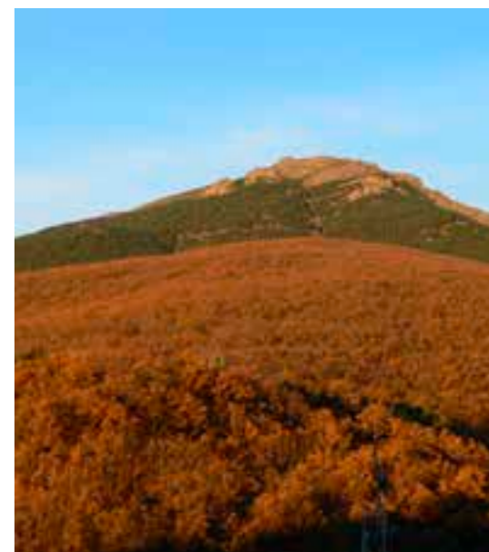
Monte de la Raya y La Najarra SL 05