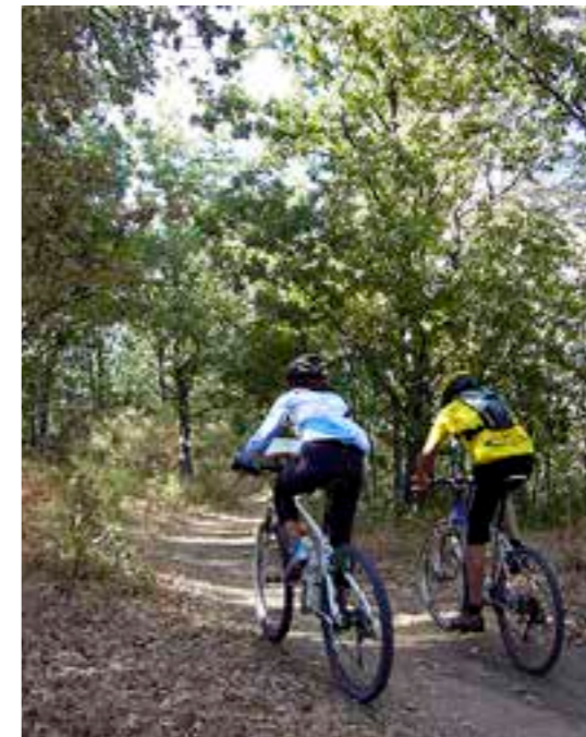
Parada del Rey SL 02