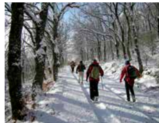
Monte de la Raya. SL 02 y SL 03