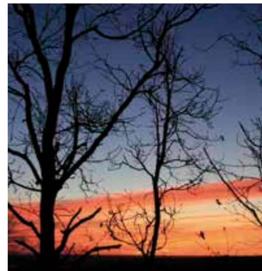
Atardecer en el robledal