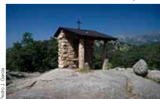
Ermita de San Blas SL 03