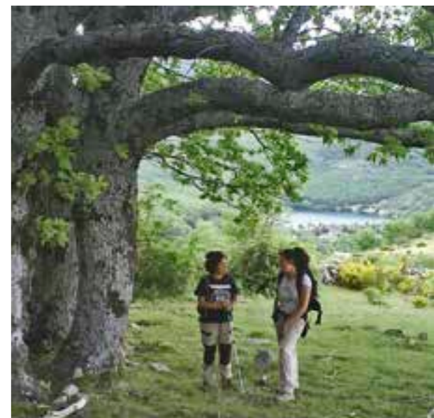
La Parada del Rey. SL 02