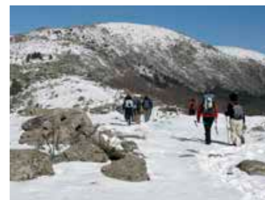
Pico de la Pala - Perdiguera SL 01