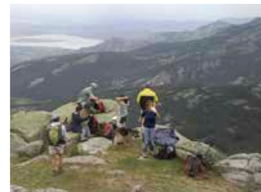
La Najarra. SL 05